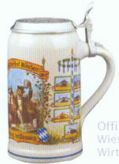
Offizieller Wies'n Wirtekrug

ohne Zinndeckel ..... € 12,50 mit Zinndeckel ..... € 27,00